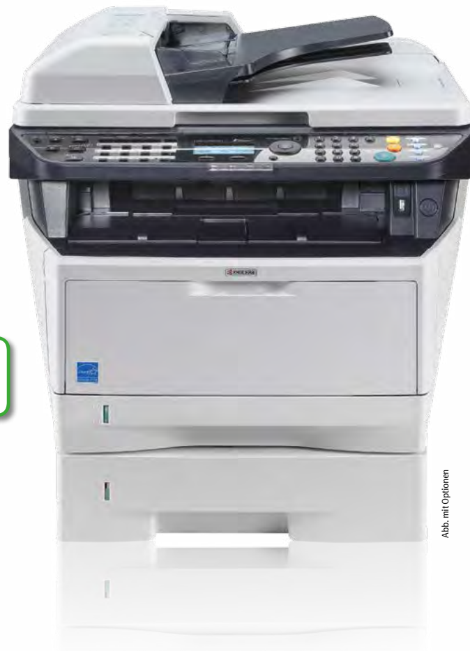
Abb. mit Optionen