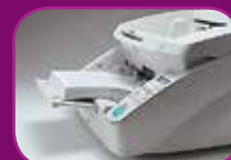
Mittlere Position (300 Blatt)