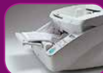
Höchste Position (100 Blatt)

Der automatische Dokumenteneinzug bietet drei Zufuhrmodi (100, 300 und 500 Blatt), die je nach Auftragsumfang angepasst werden können und so Zeit sparen und den Durchsatz steigern.