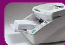
Unterste Position (500 Blatt)