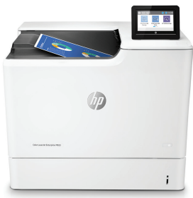
HP Color LaserJet Enterprise M653dn

Dieser HP Colour LaserJet-Drucker mit JetIntelligence kombiniert außergewöhnliche Leistung und Energieeffizienz mit Dokumenten in professioneller Druckqualität zum richtigen Zeitpunkt – Ihr Netzwerk bleibt dabei durch die branchenweit umfassendsten Sicherheitsfunktionen geschützt. 1